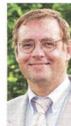
AUTOR EDGAR MÜLLER Geschäftsführer, Fokus-Mittelstands- beratungsgesellschaft, Frankfurt, mueller@ fokus-ub.de

Industrie- und Handelskammern sowie Handwerkskammern sind für gründungsinteressierte Unternehmen erste Anlaufstellen. Ihnen liegen Informationen über öffentliche Fördermittel vor, da sie auch in die Beantragung einbezogen sind. Weiterhin können sie im Einzelfall weiterhelfen, wenn es um weiterführende Beratungsmöglichkeiten geht.